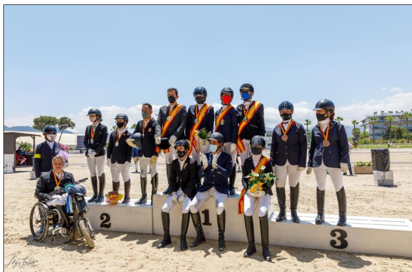
Imagen 2. Asistentes del Campeonato de España y Criterium Nacional

En lo que se refiere a la competición, tal y como antes se detallaba, a pesar de la difícil situación atravesada hasta el mes de abril, la respuesta de todos los agentes relacionados, deportistas y sus familias, entrenadores, comités organizadores,... fue masiva una vez se pudo retomar la actividad, consiguiendo no sólo mantener los datos obtenidos en 2019 sino superarlos, tanto en lo que se refiere al número de competiciones inclusivas de Doma desarrolladas, pasando de 13 a 18; como en el número de salidas a pista, pasando de 90 a 123. La proximidad de la fecha de celebración del Campeonato de España a principios de junio, consiguió que todos nuestros binomios retornaran a la Competición con motivación por conseguir las medias que les permitirían participar, donde finalmente lo hicieron 18 entre el Campeonato y el Criterium Nacional.