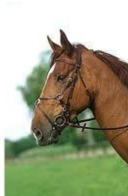
4. Muserola Cruzada/Mejicana