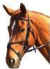
5. Muserola combinada sin ahogadero