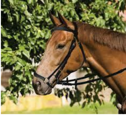
1. Muserola Alemana