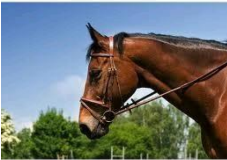
3. Muserola tipo Flash