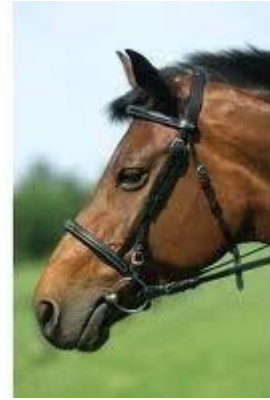
2. Muserola Normal