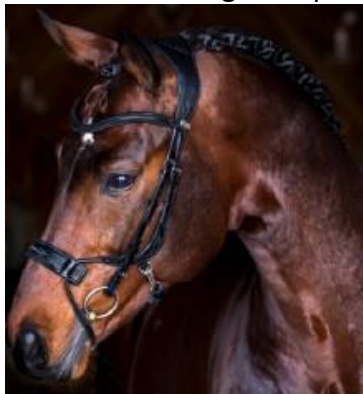
7. Muserola High Jump