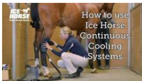
Máquinas de frío