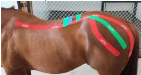
Kinesio-terapia en la cuadra