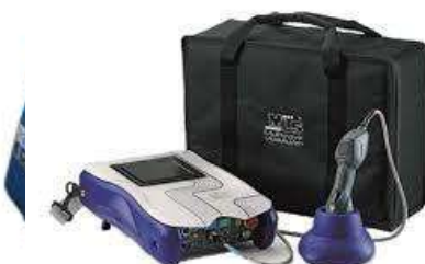
Masajes y equipos